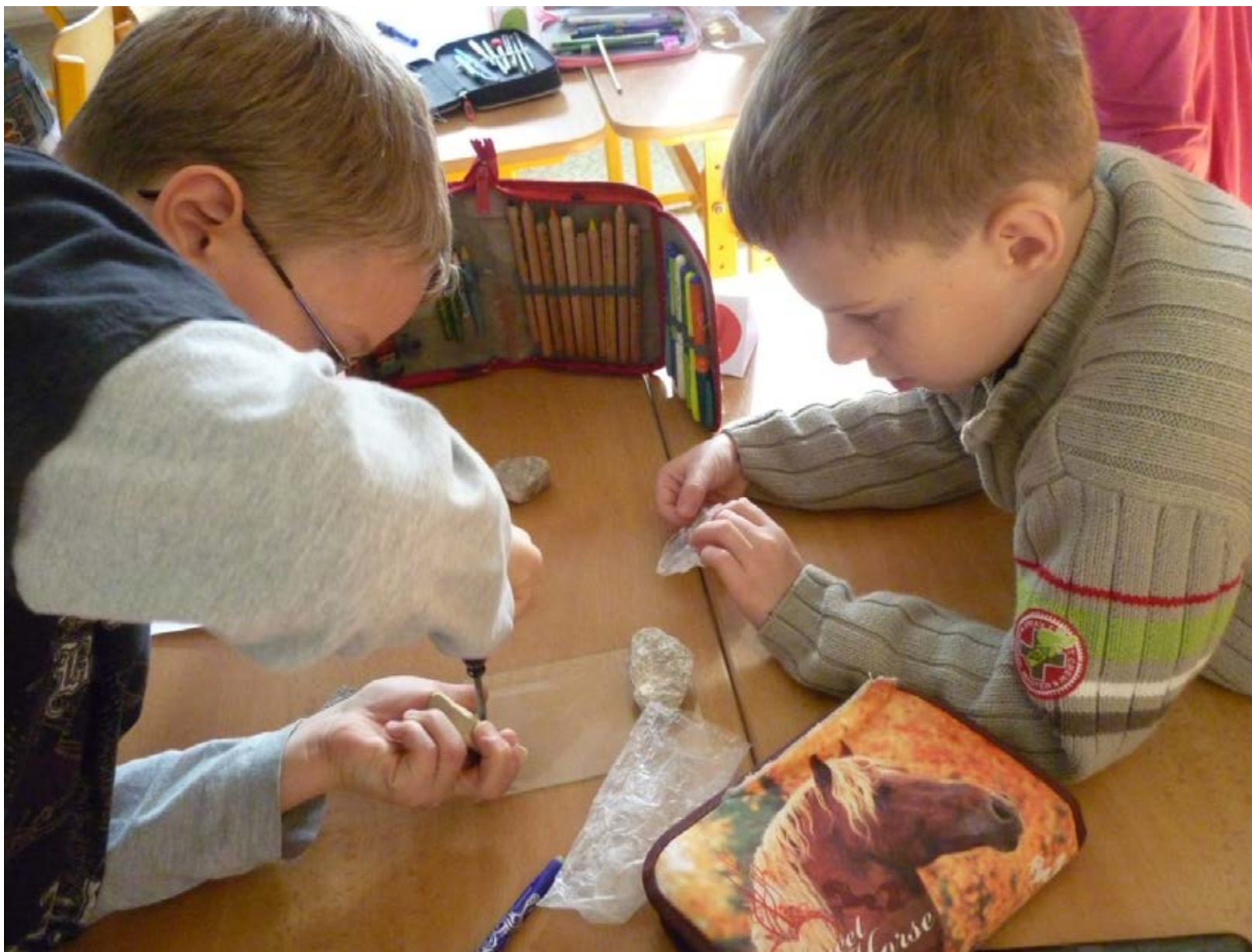
Prostějov, Mensa konference, 19. 11. 2014