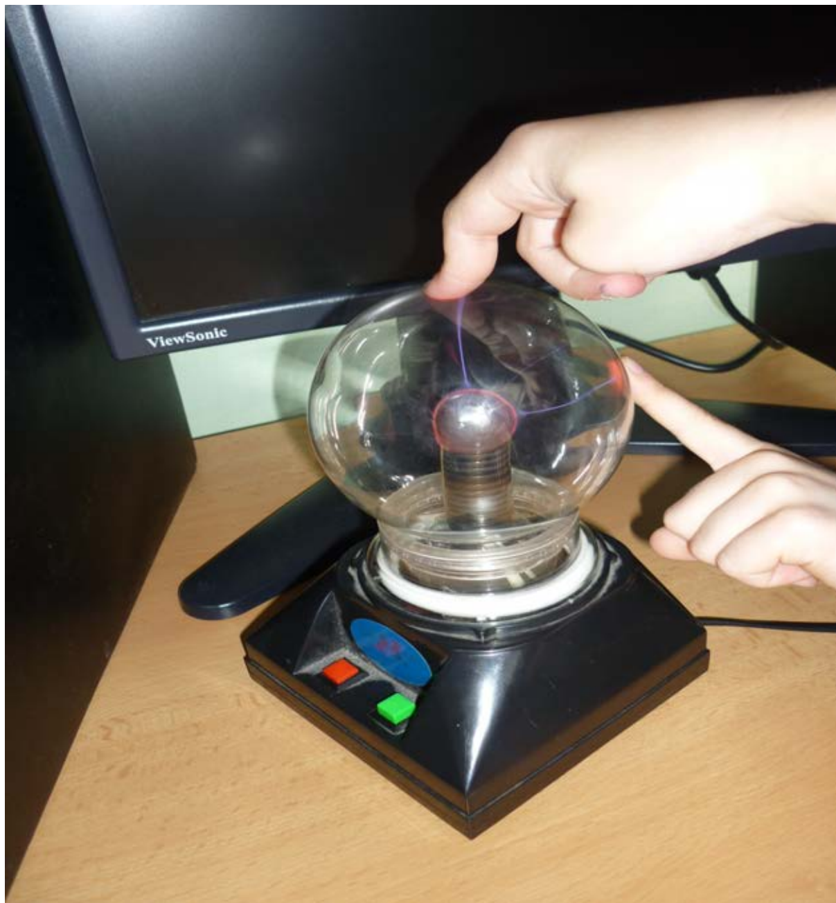
Prostějov, Mensa konference, 19. 11. 2014