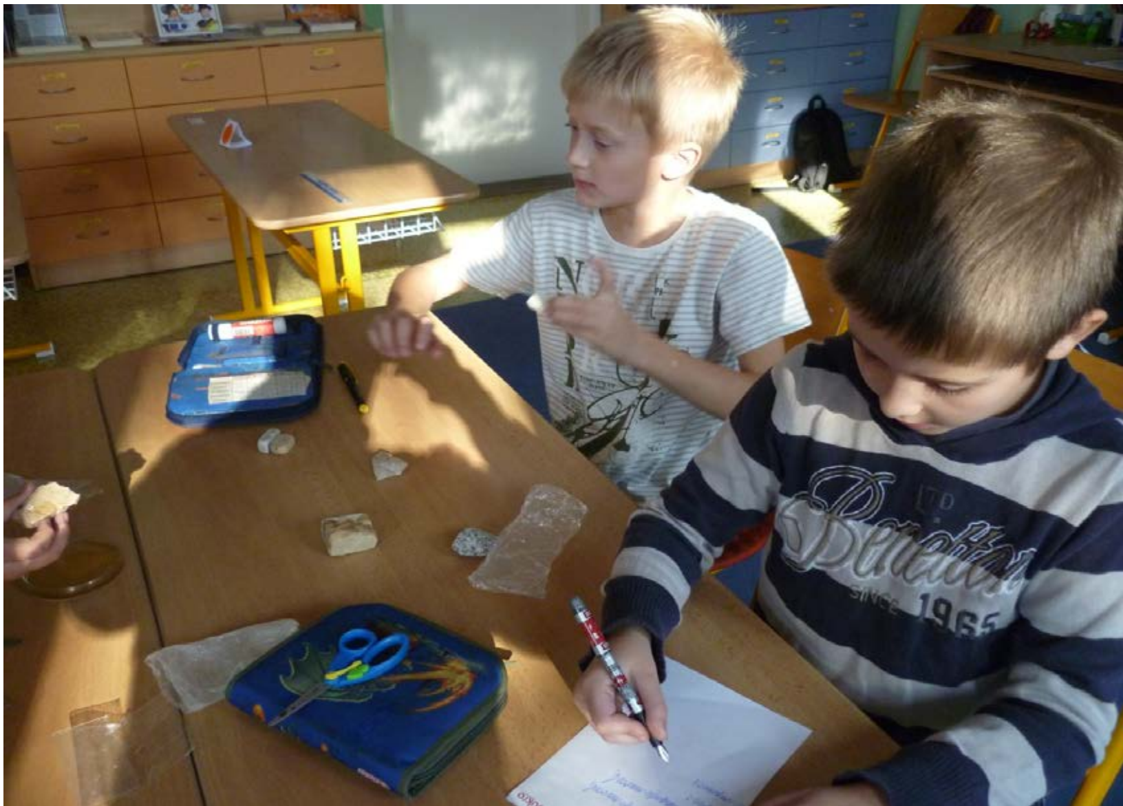
Prostějov, Mensa konference, 19. 11. 2014