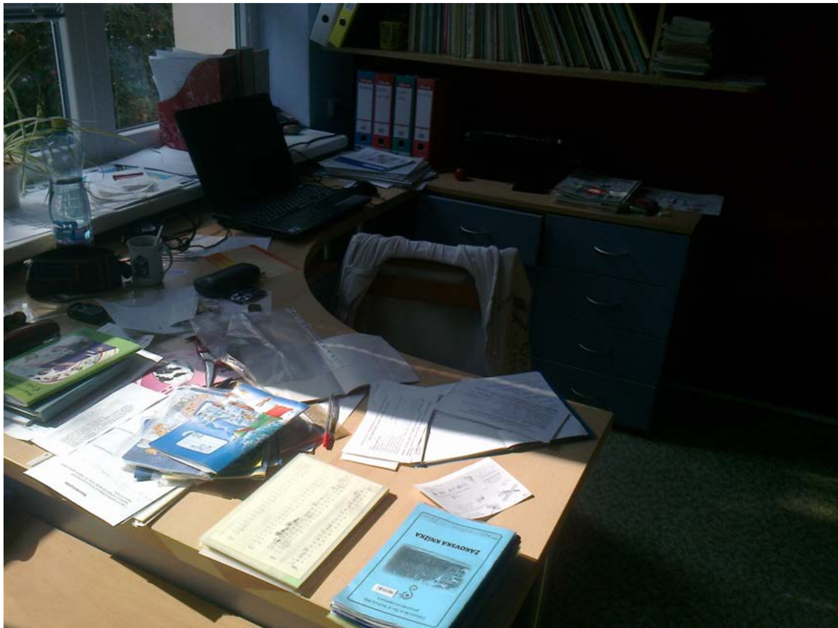
Prostějov, Mensa konference, 19. 11. 2014