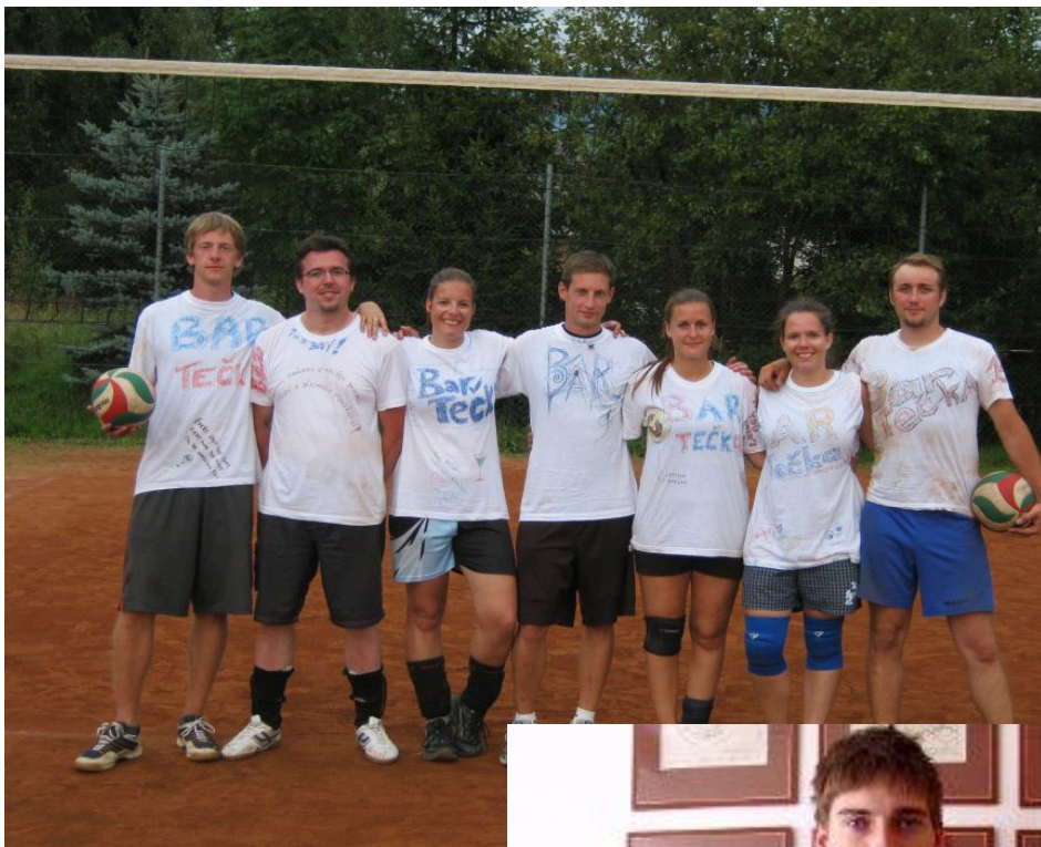
Volejbalový tým Nullo Modo Postup do celostátního turnaje Mixů (7. místo)