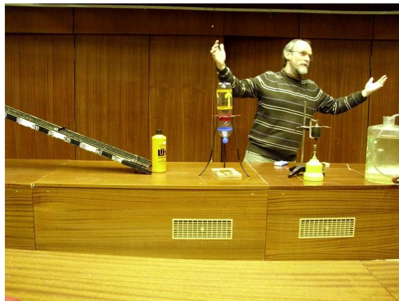
Fyzikální seminář na MFF UK